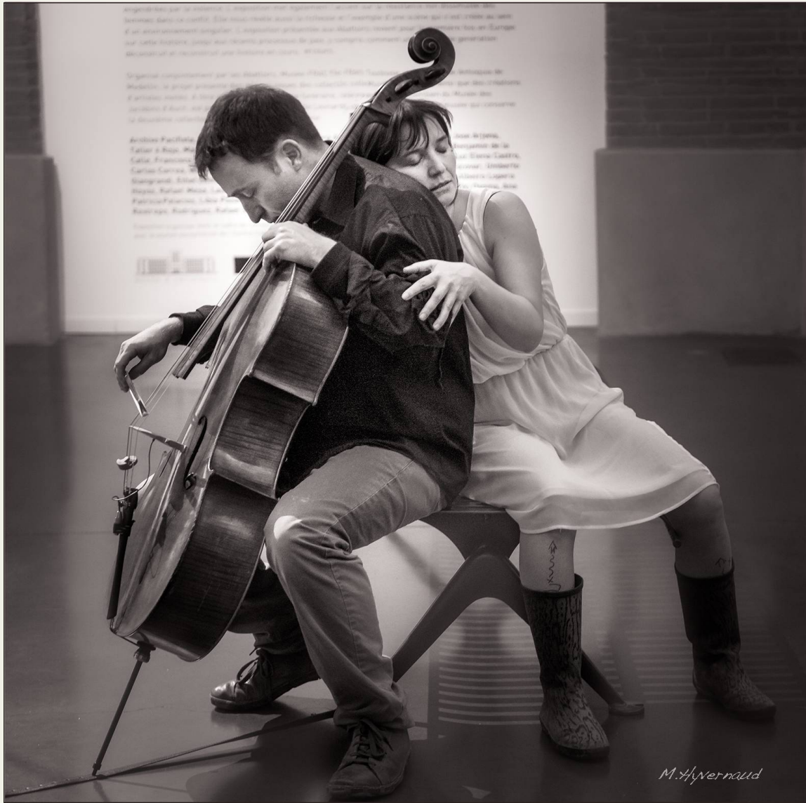
Symbiose - BW

Duo musique, poésie signée d'après « Le livre de lecture » de Gertrude Stein & les reproductions à partir des illustrations originales d'Alice Lorenzi